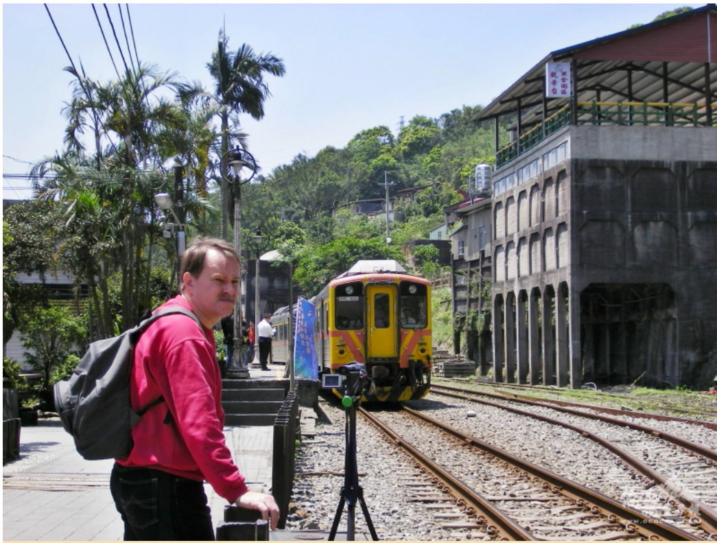
Heinofoger besucht Taiwans Nebenbahnen