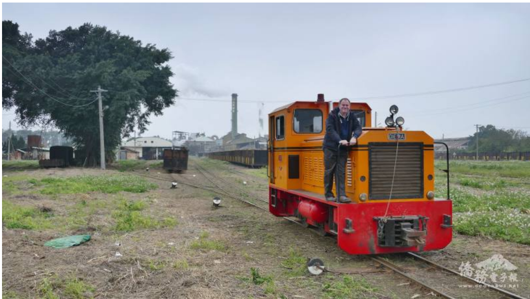
In der Anfangszeit kaufte die Taiwan Railway viele deutsche Lokomotiven, was auch zu einer wichtigen Beziehung zwischen der Taiwan Railway und Deutschland wurde.