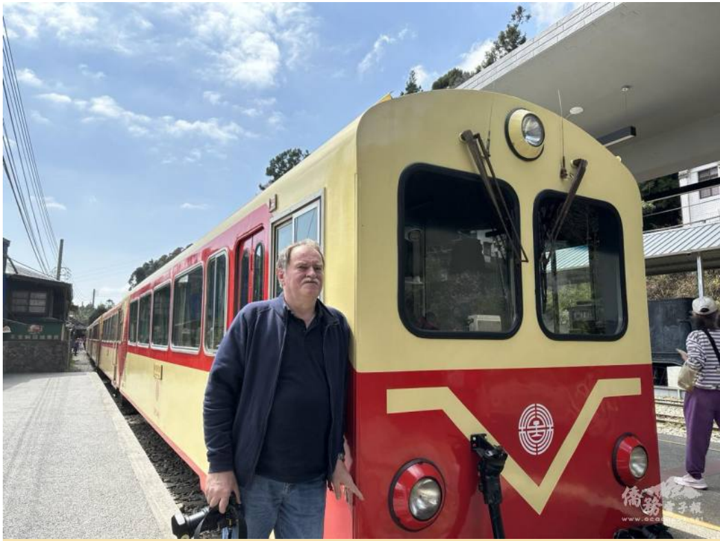
臺灣鐵道迷海諾佛格多年來走訪臺灣鐵道旅行