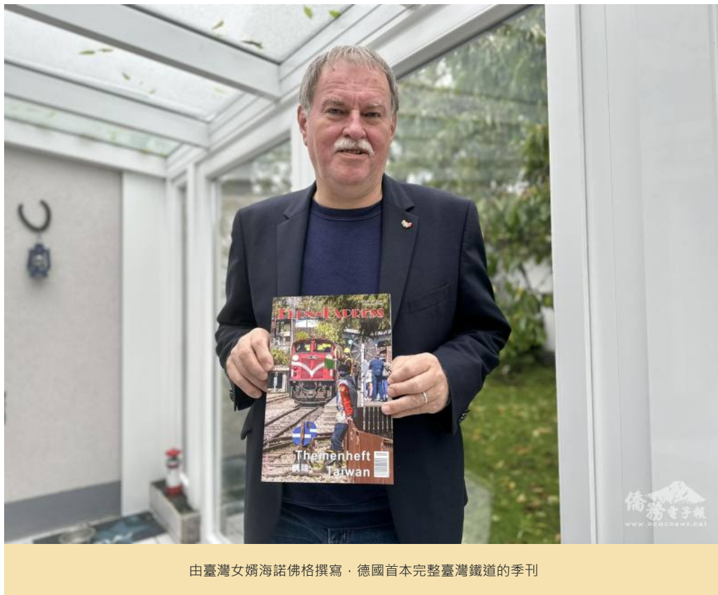
由臺灣女婿海諾佛格撰寫 · 德國首本完整臺灣鐵道的季刊